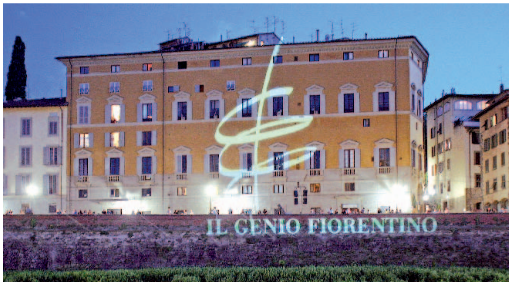
Il logo del Genio Fiorentino proiettato su un Palazzo del lungarno Torrigiani a Firenze

«La crisi più grave del previsto e la ricerca di protezionismi possono frenare lo sviluppo»