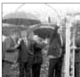
►► El alcalde elevó la compuerta.