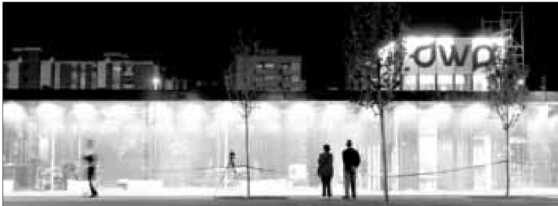
►► El pabellón de Agua Digital, durante las pruebas técnicas a las que se sometió esta semana.