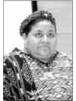
►► Rigoberta Menchú.