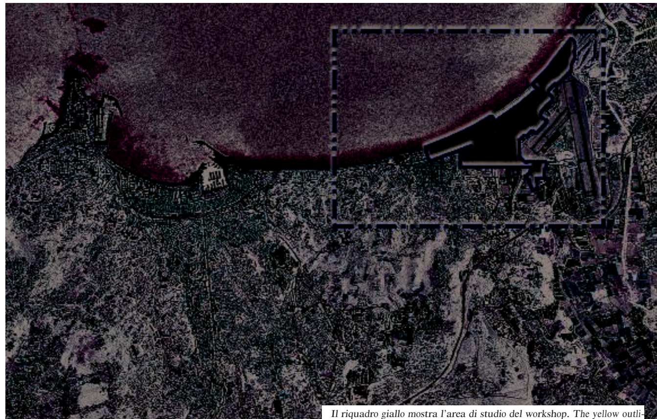
Il riquadro giallo mostra l'area di studio del workshop. The yellow outline shows the study area for the workshop.

Cannes oggi è principalmente una meta turistica, la città del festival e delle vacanze al mare. La popolazione si triplica durante l'estate e in occasione di eventi come il Film Festival. Usando informazioni come i dati sulla raccolta dei rifiuti, gli studenti hanno sviluppato 'paesaggi di informazioni' che mostrano come il metabolismo della città raggiunge i suoi picchi in vari momenti dell'anno, con un utilizzo delle risorse non ottimale che forza l'infrastruttura urbana. Cannes today functions mostly as a tourist, festival, and retirement destination. The city's population triples during the summer months and certain conventions like the Film Festival. By using data points such as trash collection, students have developed 'infoscapes' that show how the city's metabolism peaks at various moments of the year, with a suboptimal use of resources that strains the urban infrastructure.